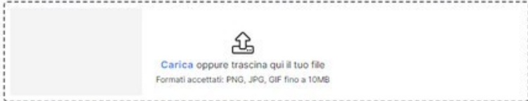
Immagine - opzionale

Le dimensioni consigliate per il prodotto sono 500x500